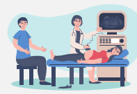
Gastos de embarazo y del parto.