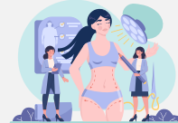
Cirugía plástica con fines estéticos